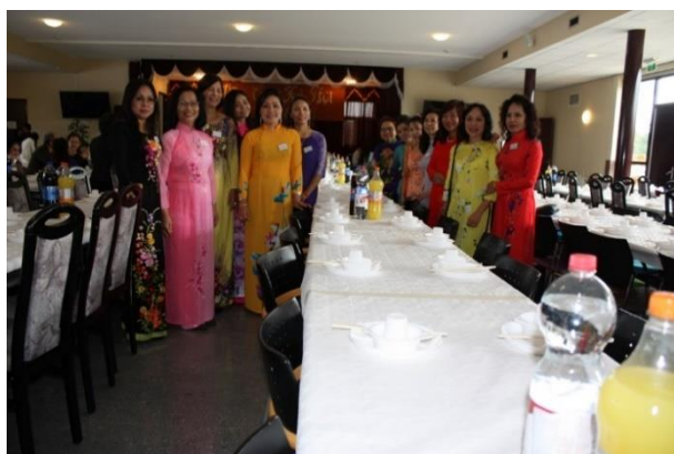
Ban Tiếp Tân