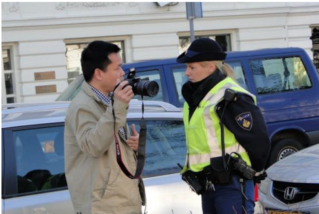
Một nhân viên của tòa đại sứ Việt Cộng muốn chụp ảnh cảnh sát Hòa Lan cảnh cáo

Cuộc biểu tình và cầu nguyện cho quê hương chấm dứt khoảng 21g30, mọi người chia tay trong niềm tin vào một ngày mai tươi sáng của dân tộc Việt Nam.