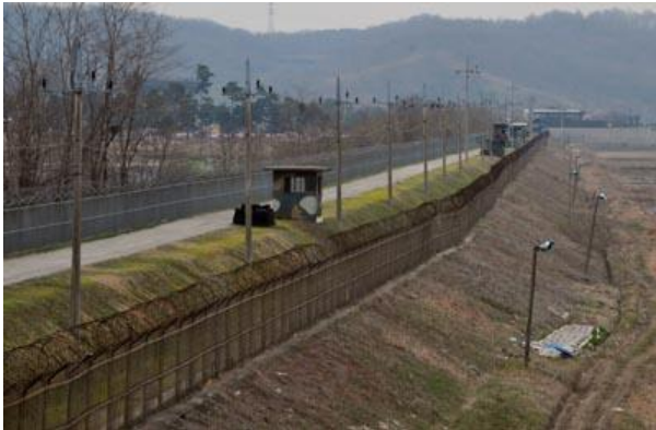
Một đoạn biên giới Nam - Bắc Hàn

SEOUL, Nam Hàn (AP) - Bắc Hàn lại đe dọa Mỹ và Nam Hàn về cuộc thao dượt hải quân hỗn hợp diễn ra trong đầu tháng 5 này ở Hoàng Hải trước ngày có cuộc họp thượng đỉnh giữa giới lãnh đạo hai nước.