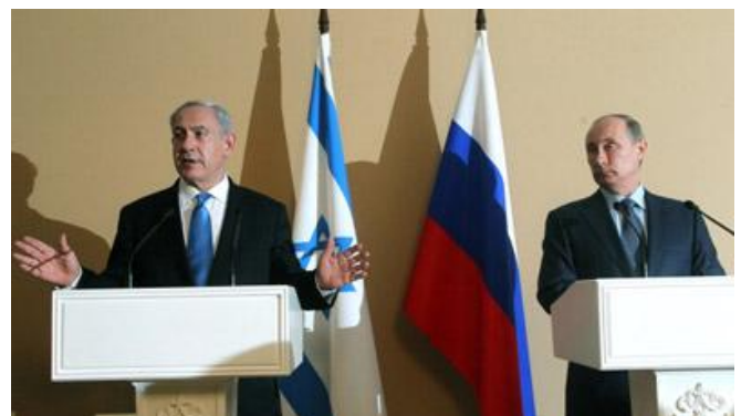
Thủ Tướng Israel (trái) và Tổng Thống Nga trong buổi họp báo chung sau cuộc hội đàm tại Sochi, Nga

SOCHI, Nga (Haaretz) – Thủ Tướng Benjamin Netanyahu đang đến thăm Nga, tháp tùng có tướng Aviv Kovachi chỉ huy trưởng tình báo quân sự Israel, hôm Thứ Ba đã gặp và hội đàm trong hơn 3 giờ với Tổng Thống Vladimir Putin.