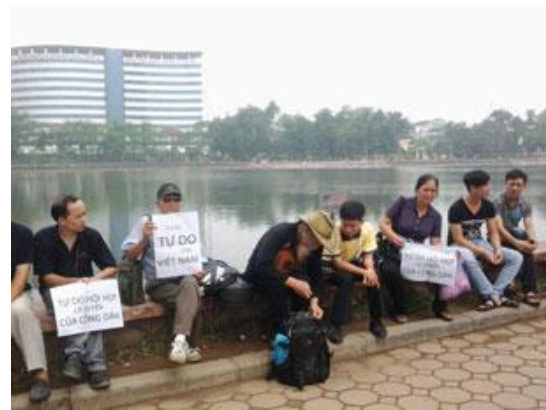
Buổi dã ngoại cho nhân quyền Việt Nam tại Hà Nội hôm 05/5/2013

Theo lời kêu gọi từ suốt mấy tuần qua trên các trang mạng xã hội về những buổi dã ngoại từ Bắc chí Nam, với 3 địa điểm tập trung để trao đổi với nhau về bản Tuyên Ngôn quốc tế Nhân Quyền mà Việt Nam đã ký vào ngày 20/9/1977 và cùng chia sẻ những điều liên quan đến quyền làm người.