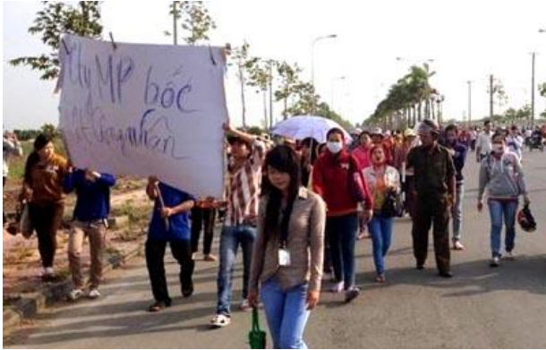
Cuộc đình công diễn ra tại Việt Nam năm 2012.

gồm: điện lực; dầu khí; an ninh hàng không; viễn thông – bưu chính; cấp nước và thoát nước; vệ sinh môi trường và an ninh quốc phòng.