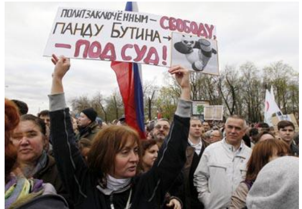
Đoàn người tuần hành tại trung tâm thủ đô Moscow.

MOSCOW (NYT) - Hàng ngàn người xuống đường tuần hành ở Moscow hôm Thứ Hai 6 tháng 5 vừa qua để phản đối việc chính quyền Nga đang dùng hệ thống tư pháp để đàn áp thành phần bất đồng chính kiến.